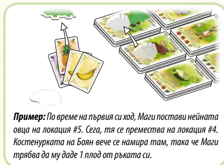
Пример: По време на първия си ход, Маги постави нейната овца на локация #5. Сега, тя се премества на локация #4. Костенурката на Боян вече се намира там, така че Маги трябва да му даде 1 плод от ръката си.

Ако купиш последния (четвърти) легендарен сок от малко тесте, това тесте вече е изчерпано и съответстващото действие вече не е налично. Ако животното ти се намира на изчерпано тесте, вземи го обратно пред себе си и по време на следващия ти ход го премести на нова локация.