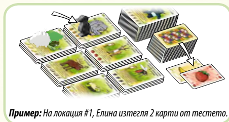
Пример: На локация #1, Елина изтегля 2 карти от тестето.