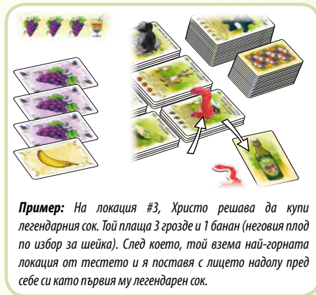
Пример: На локация #3, Христо решава да купи легендарния сок. Той плаща 3 грозде и 1 банан (неговия плод по избор за шейка). След което, той взема най-горната локация от тестето и я поставя с лицето надолу пред себе си като първия му легендарен сок.