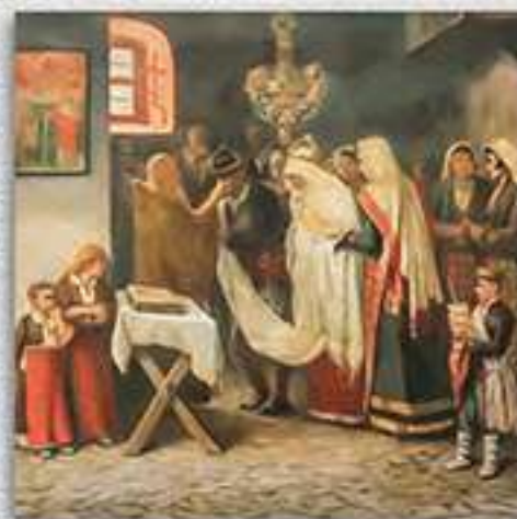
Сватба в Момчиловци