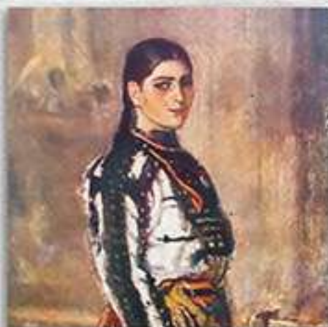
Мома от с. Брест