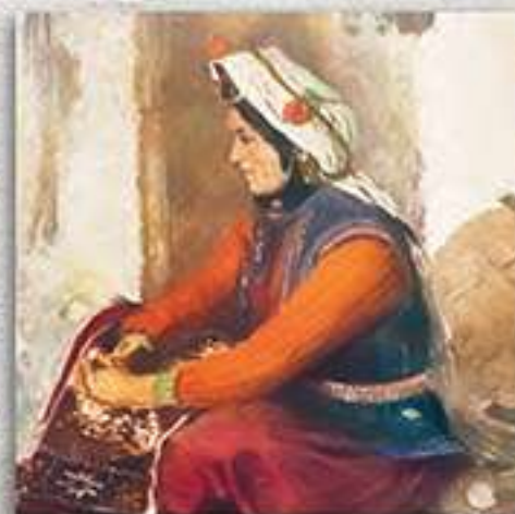
Жена от с. Налбантларе