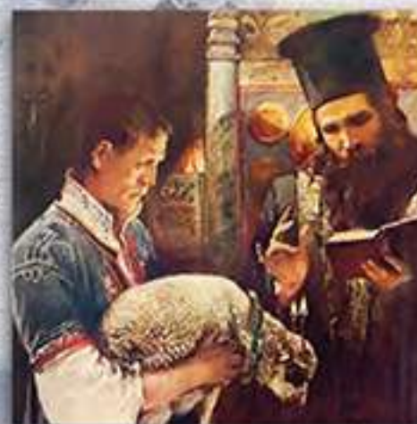
Благословение на агнето за Гергьовден

www.bulgarianhistory.org www.bulgarianhistory.shop