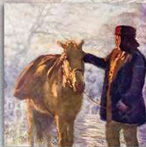
Сутринна мъгла (Софийско)