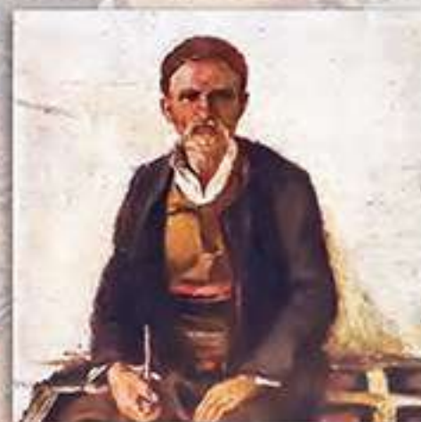
Мъж от с. Сумитли