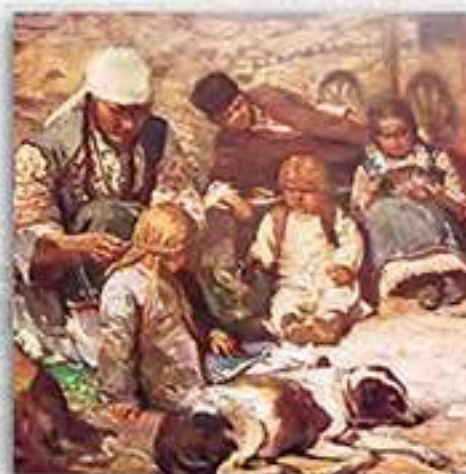
Селско семейство (Софийско)