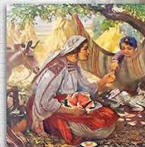
Във време на жътва (Врачанско)