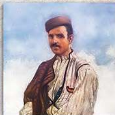
Селянин от с. Нова махала