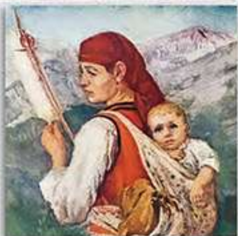
Жена от Банско