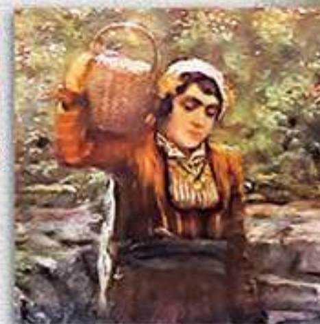
Беритба на рози