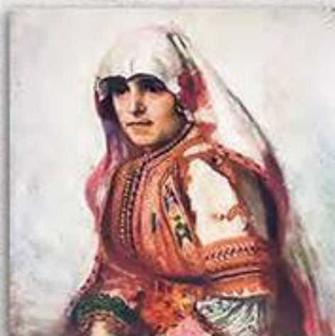
Македонка от Дебър