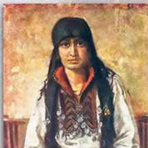
Мома от с. Радибуш