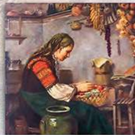
Приготовление за зимата