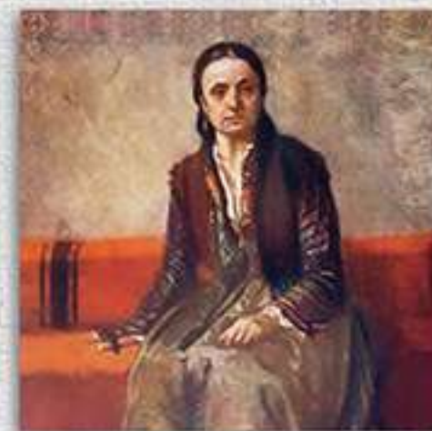
Македонка от Прилеп