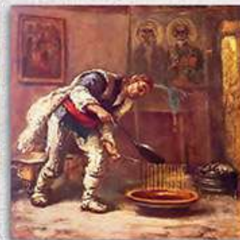
Леене на свещи (Софийско)