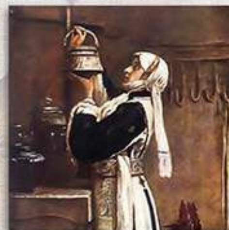
Македонка от Скопска Черна гора