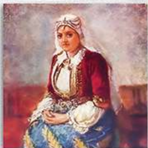
Македонка от Струга